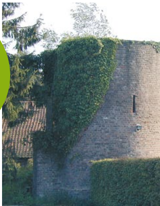
Schießturm in Gangelt