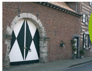
Unterster Hof in Hillensberg