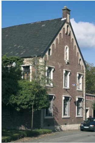
Haus Saran Millen