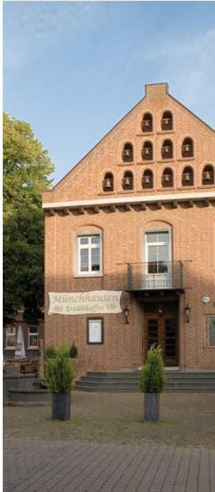
Altes Rathaus Gangelt