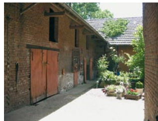
Innenhof in Harzelt