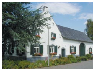
Haus Dilia in Höngen