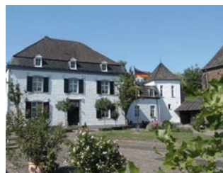
Gut Wammen in Havert