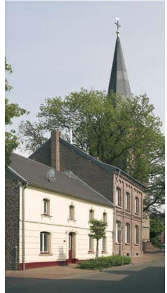
Brabanter Straße Waldfeucht